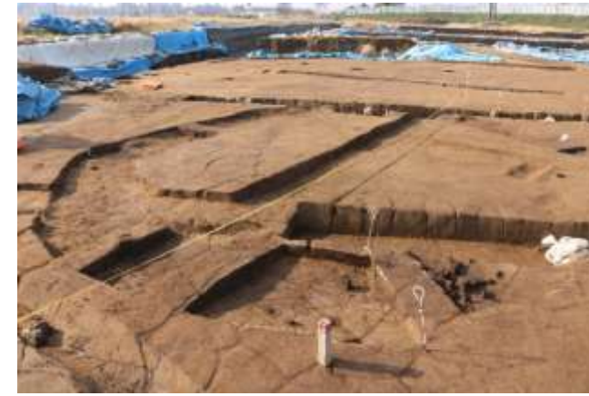
←周溝状遺構完掘写真

集落域の南で検出された。幅約3.5m、高さ約0.2～0.3mの規模で集落南端付近から真南に走行している。調査区南西の水田面では、この大畦畔と同じ軸を持つ小畦畔も見つかっており、水田小区画が存在していたことが推定される。