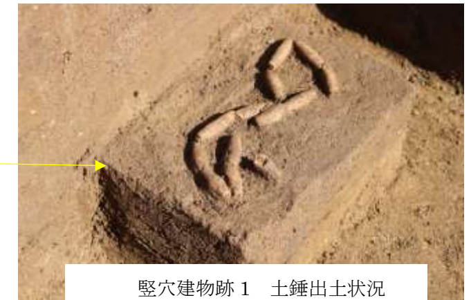
竪穴建物跡1 土錘出土状況