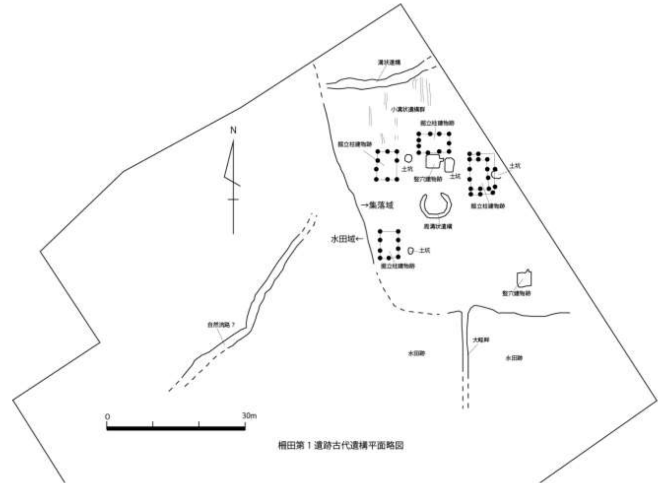
柵田第1遺跡古代遺構平面略図