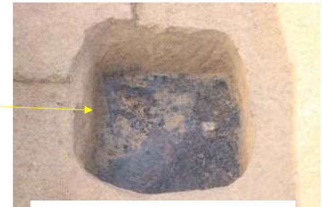
竪穴建物跡2 土坑 炭検出