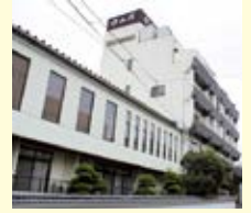
④ ホテル 中山荘