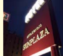
② 都城サンプラザホテル