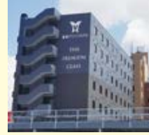
① 都城グリーンホテル