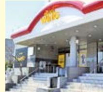
③ ホテルウィング インターナショナル都城