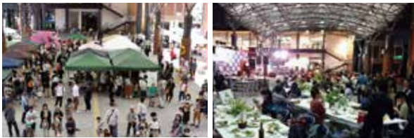
マルシェで買い物を楽しむ ライブを聞きながらディナー