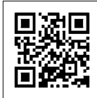
まちたん ホームページ