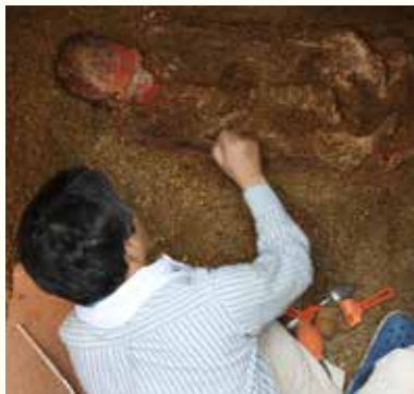
墓の中の様子 (平成29年度調査)

本作品は、7月1日(日)まで開催する収蔵作品展「明治を生きた画家たち ~維新を越えて~」で展示しています。