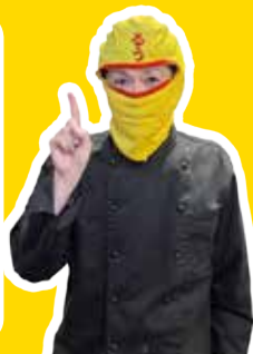
チキン南蛮カレー王子 (通称：ルウ王子)