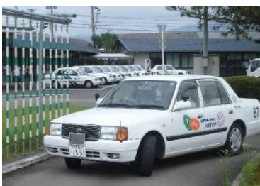
自動車学校での実車訓練