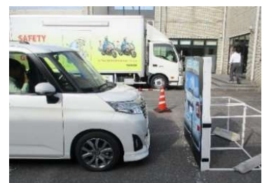
サポカーS乗車体験