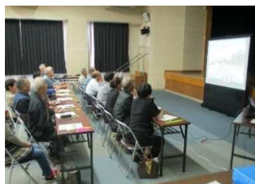
トレーニング講習