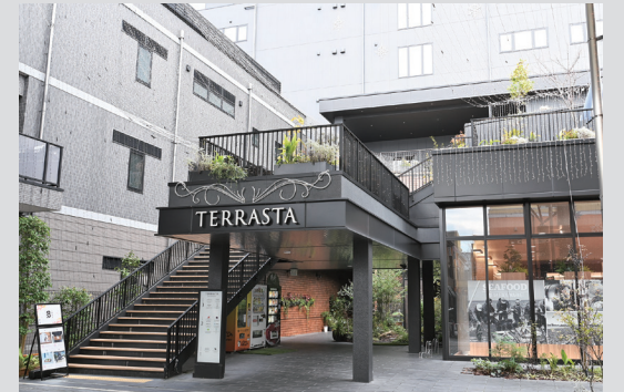
TERRASTA 2階にある事務所では16人の職員が各種業務に携わっています。