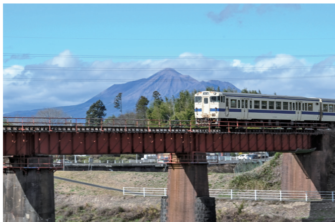
「霧島と吉都線」(乙房町)

レジャーも温泉も花見も満喫できる 観音池公園に行ってみよう！ 高城町石山にある観音池公園は、江戸時代に造られたかんがい池「観音池」を中心とした、東京ドーム約13個分の広さを有する公園です。園内には県内唯一の観覧車や、九州最長のスライダーをはじめ、ゴーカートやリフト、オートキャンプ場など遊具や設備が充実しています。1日中満喫できます。公園で遊んだ後は、園内にある温泉施設「観音さくらの里」の露天風呂やサウナなど13種類のお風呂で、ゆっくりと汗を流すことができます。