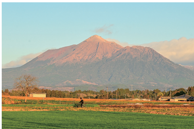
「霧島と自転車通学する高校生」(山田町中霧島)