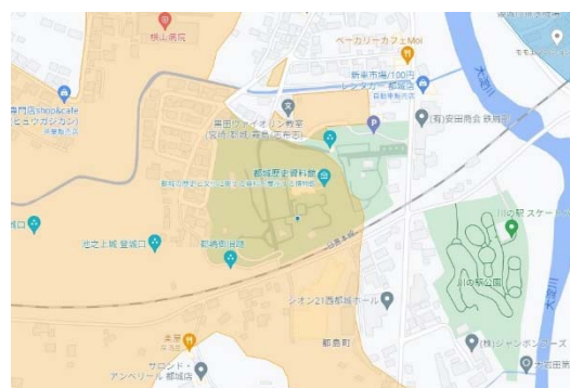
デジタル遺跡地図（都城歴史資料館付近・拡大）