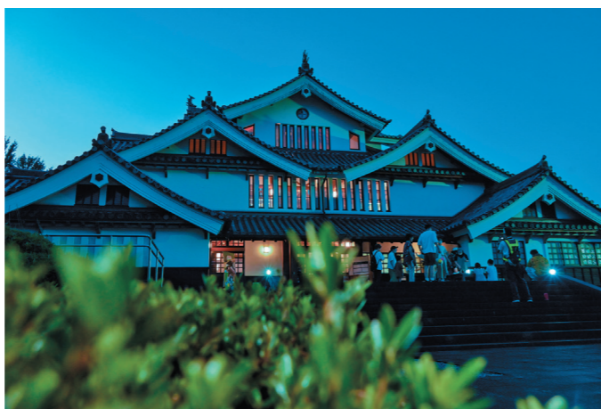
「都城歴史資料館・ナイトミュージアム」(都島町)