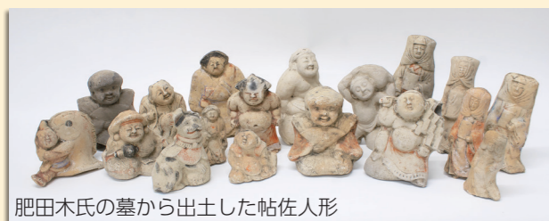
肥田木氏の墓から出土した帖佐人形

※本資料の一部は、11月26日(日)まで開催中の企画展「モノからわかる江戸時代~人々のくらしと産業~」で展示中