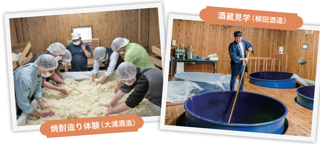
酒蔵見学(柳田酒造)