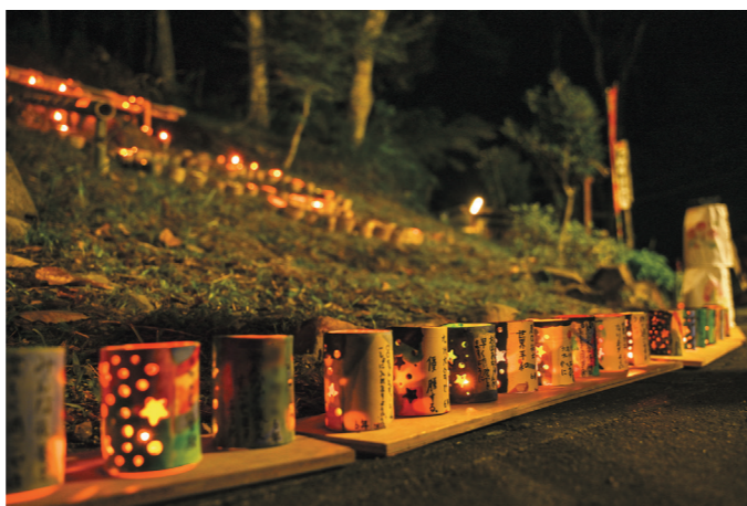
「石山観音寺・キャンドルナイト」(高城町石山)

日本一の肉と焼酎のふるさとで特別な酒蔵体験を! 本市は、牛・豚・鶏の合計産出額日本一を誇り、また焼酎売上高日本一の焼酎メーカーがある「日本一の肉と焼酎のふるさと」です。市内には4つの焼酎蔵があり、サツマイモの収穫に合わせて毎年9月ごろから芋焼酎造りが始まります。 その製法は伝統的なものや大規模なものなど酒蔵によってさまざま。各酒蔵では一般の人が参加できる酒蔵体験メニューが用意されています。例えば、霧島酒造では焼酎造りの工程を見学、柳田酒造では酒蔵見学や蔵元によるおいしい飲み方講座などがあります。また、大浦酒造では期間限定で焼酎造りの体験ができます。 各酒蔵の製法や、造り手のこだわり、熱い思いに触れ、好みのお酒に出会ってみませんか。