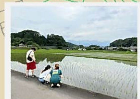
田んぼを眺めてみよう