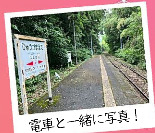
電車と一緒に写真！

都城市と高原町にまたがる湖。日本国内の火口 湖の中では最も深く103mあります。 開けた湖の奥には高千穂峰を望むことができ、 夏になると船遊びやキャンプなどで賑わいます。