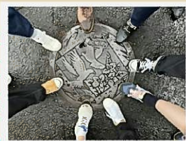
マンホールタッチ!