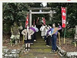
仁王像になりきって