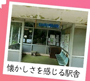
懐かしさを感じる駅舎

自然に包まれた隠れ家のような無人駅。 1947年に開業し、都城市に広がる吉都線 の中の駅の一つです。電車を見たらラッ キー！