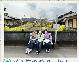
バス停の前で一枚!