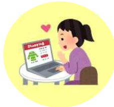
ネットショッピング

近年インターネットの普及やデジタル化が急速に進み、私たちの生活は便利で楽しいものになりました。しかし、その一方でインターネット、デジタル化に伴う消費者トラブルも増加しています。より豊かな消費生活を営むために消費生活センターから情報発信をしていきたいと思っています。