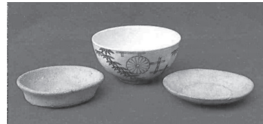
桃園天皇御下賜品