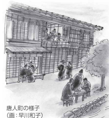
唐人町の様子 (画:早川和子)