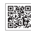
オンライン申請 手続検索サイト