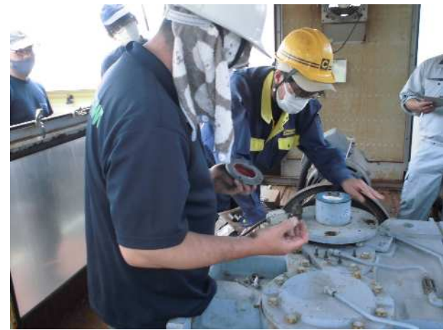
減速機グリス状態確認