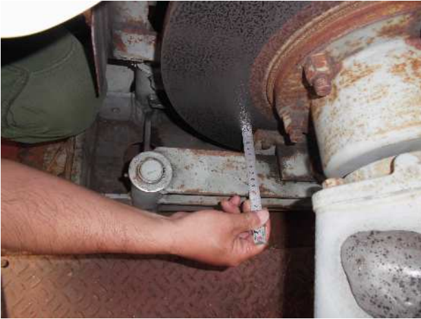
常用ブレーキパッド厚測定