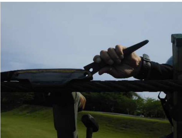
搬器タンク交換修繕