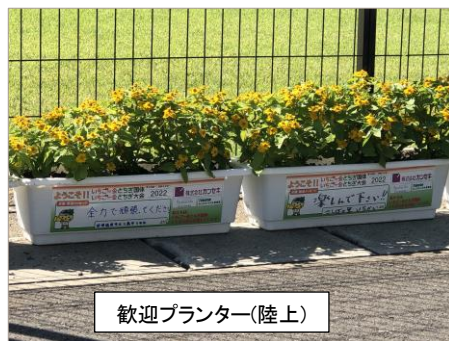
歓迎プランター(陸上)