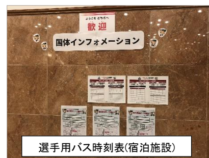
選手用バス時刻表(宿泊施設)