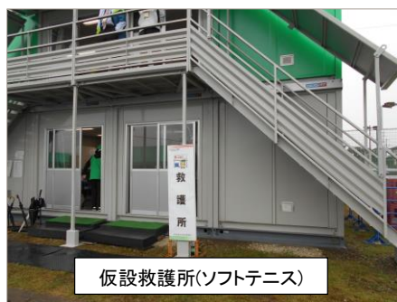
仮設救護所(ソフトテニス)

各競技会場では、観覧席・トイレや実施本部(記録・救護所等)などの仮設物が設置されており、競技によっては競技専用の仮設施設等も設置されていた。