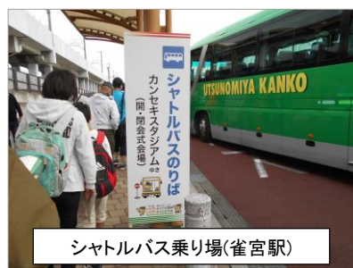
シャトルバス乗り場(雀宮駅)