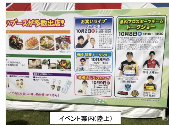
イベント案内(陸上)