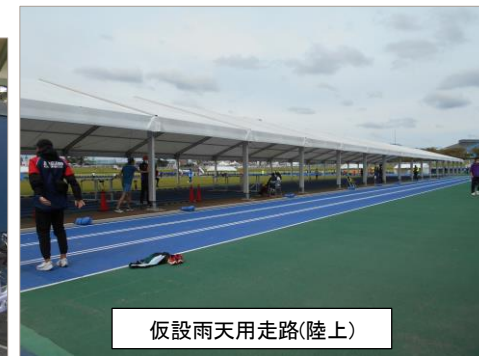
仮設雨天用走路(陸上)