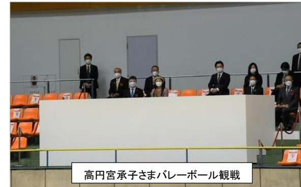
高円宮承子さまバレーボール観戦