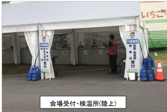
会場受付・検温所(陸上)