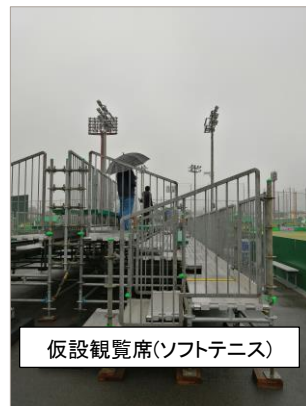
仮設観覧席(ソフトテニス)