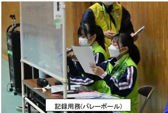
記録用務(バレーボール)