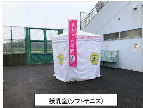
授乳室(ソフトテニス)