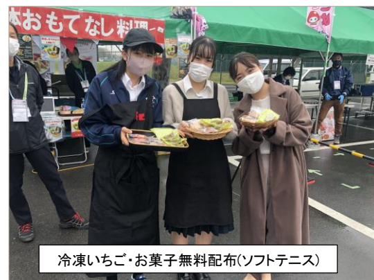
冷凍いちご・お菓子無料配布(ソフトテニス)