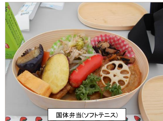
国体弁当(ソフトテニス)