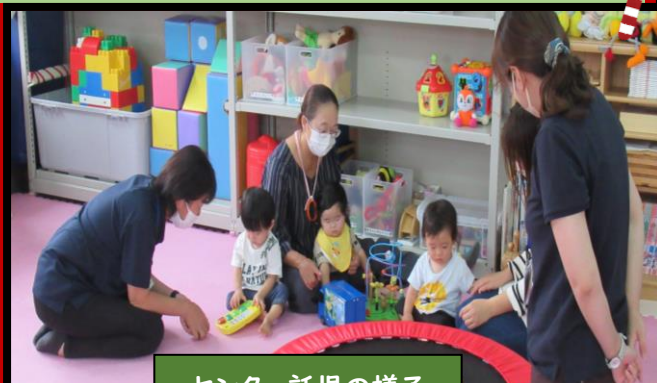
センター託児の様子