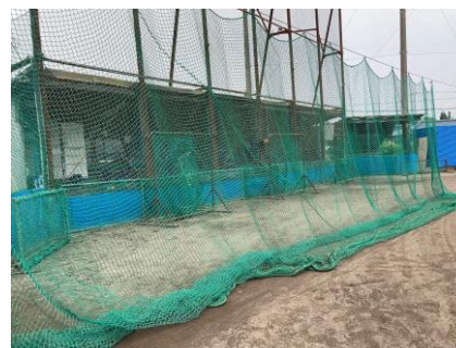
ワイヤーカーテンネット