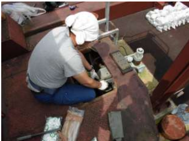
非常用ブレーキパッド交換