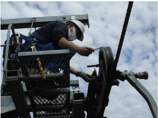
脱索検出装置作動確認