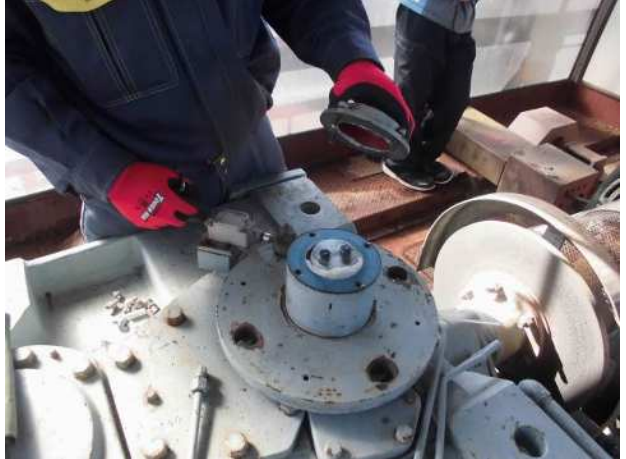
減速機グリス状態確認