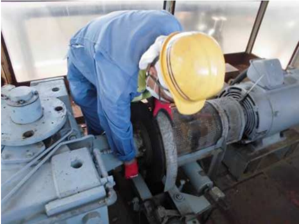
常用ブレーキパット厚測定