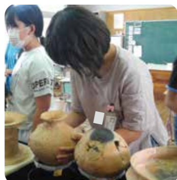
「弥生時代の土器って意外と軽い?」