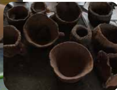
子どもたちの1人1人の個性が光ります☆