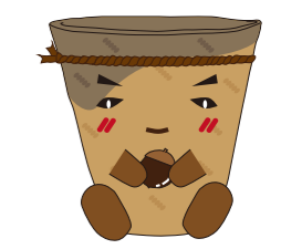
都城市マイブンキャラクター「いそいちくん」