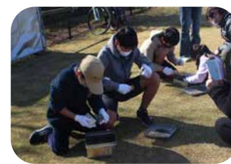
カチカチ火起こし