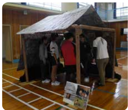
「縄文時代の竪穴住居ってどれくらいの大きさがあるの?」