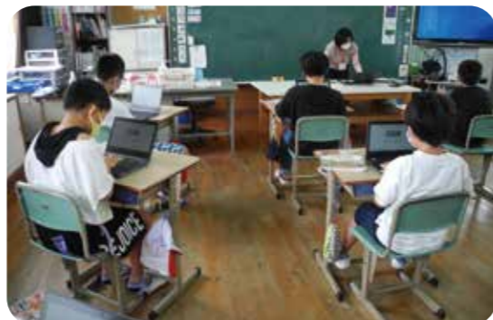
タブレットを使って古墳時代のお墓の中に入ってみよう!