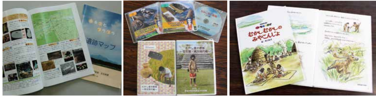
ふるさとプラブラ遺跡マップ