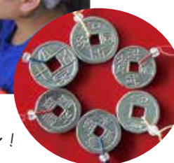
色々な種類のお金があるんだね~!