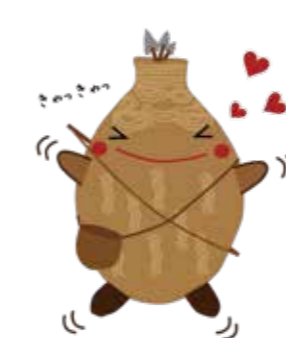
都城市マイブンキャラクター「たむたむ」