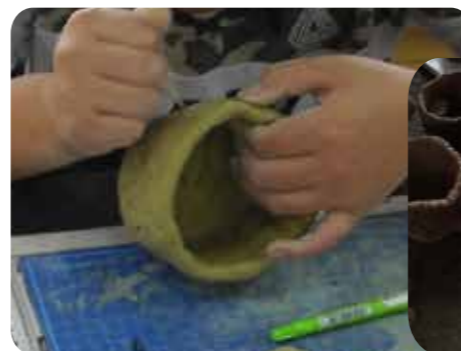
ミニ縄文土器作り

また学校内での授業のほか、 校区内の古墳や大島畠田遺跡(金田町) などの現地見学、 都城跡(都島町) での城跡探検も実施しています。遠足や社会科見学で都城歴史資料館を利用される場合に、見学に合わせて体験もできますのでご相談ください。 *体験は低学年にも対応しています。