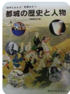
毎年6年生全員に配付「都城の歴史と人物」授業の中でも使います!

A: 体験に係る材料費も含め、全て 無料 です。 *時間を割けないという学校は、出土品の貸し出しも行っていません。貸出資料についてはお問い合わせください。