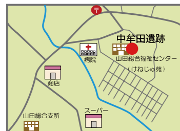
中牟田遺跡周辺地図