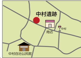
中村遺跡周辺地図