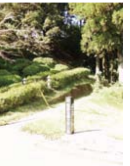
現在の様子(大手口)