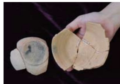
中世のお皿(素焼き)