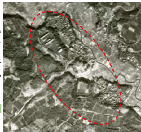
山田城跡航空写真(昭和 22年)