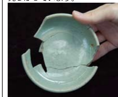
青磁(中国でつくられたお茶碗)