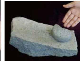
磨石 (上の丸い石) と石皿 (下の石) ドングリなどを磨りつぶす道具