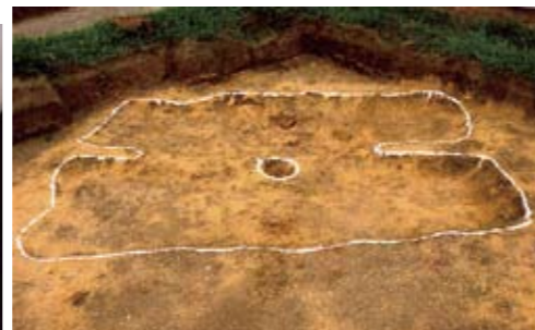
弥生時代の竪穴住居跡