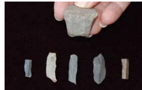
細石刃と細石刃核

細石刃核から割り取られたのが細石刃。木の柄にたくさんはめ込んで使用する。(P20に使用想定図あり)