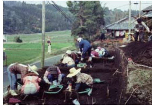
中村遺跡発掘調査の様子

道路を広くする工事の時に発掘調査を行いました。今から、3千年くらい前の縄文時代の家の跡が2軒見つかりました。遺跡からは煮炊きをする縄文土器や石のやじりや斧などの道具も見つっています。