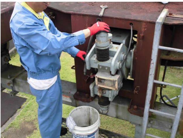
非常用ブレーキオイル交換