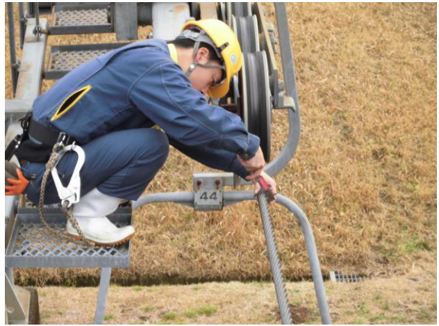
握索装置サラバネ点検