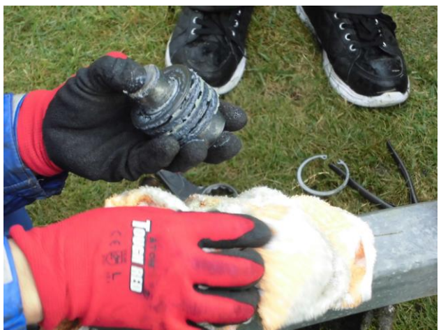
非常用ブレーキパット交換