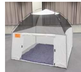
【屋内型簡易テント】