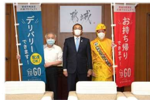
【飲食店の宅配・テイクアウトの取組を支援】