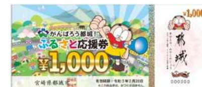
【がんばろう都城！ふるさと応援券】